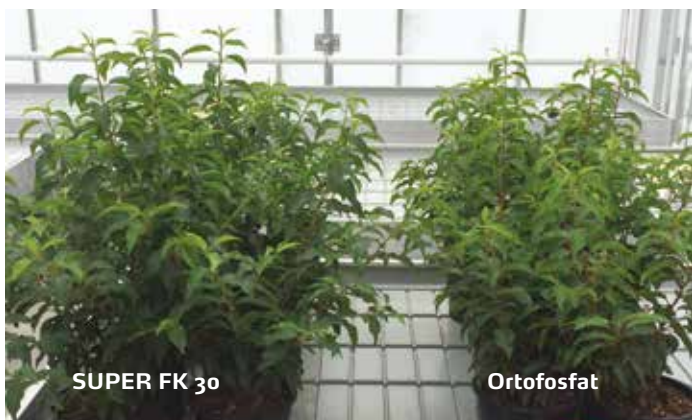
Bedre tilvekst- bedre økonomi