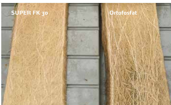
Bedre utviklet rotsystem