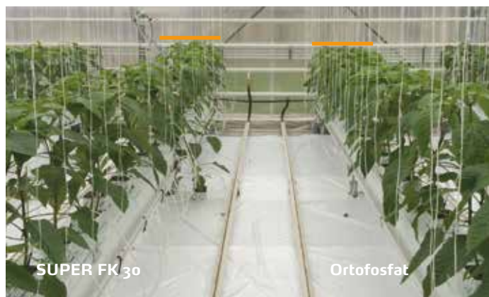
Kraftigere vekster som vokser raskere